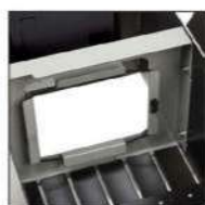
Maintien du sac par ceinture élastique