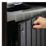
Verrouillage par serrure à clé triangulaire 8 mm