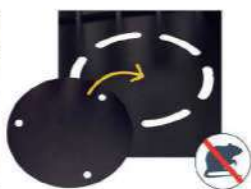
Plaque de fond anti-nuisibles fournie à installer au fond de la corbeille TERAart