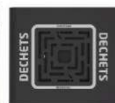
Corbeille déchets disponible avec cendrier et grille écrase mégot intégrés dans le chapeau. Capacité : 1.5L / 900 mégots