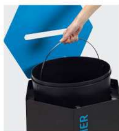
Seau intérieur en polypropylène avec anse