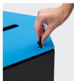
Verrouillage par serrure à clé (option)