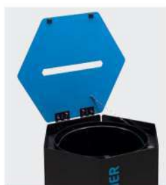
Facilité d'évacuation des déchets